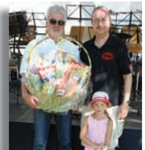
Der strahlende Gewinner unseres Schätzspiels.